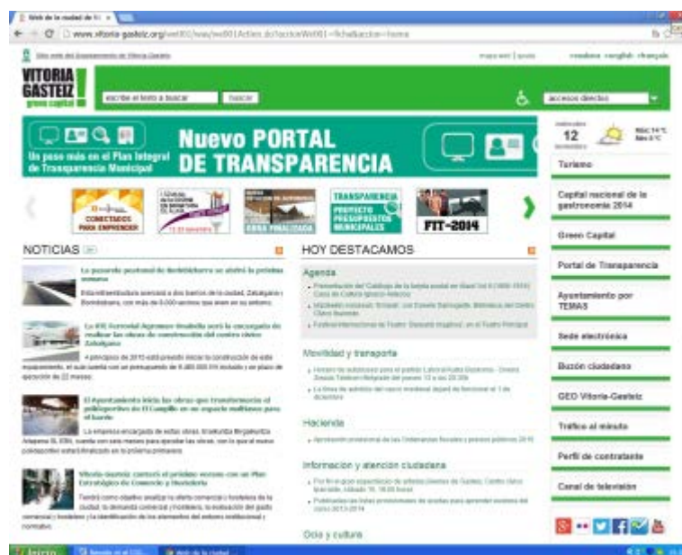
Figura 1. Página web oficial del Ayuntamiento de Vitoria-Gasteiz