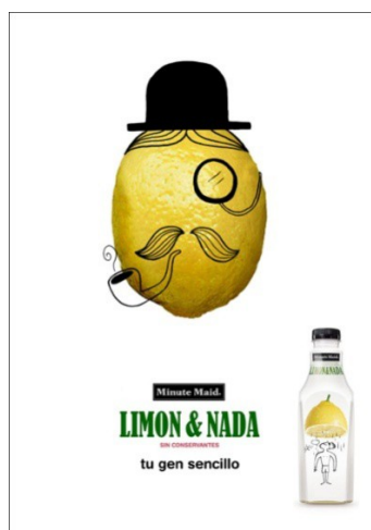
Figura 4. Cartel publicitario de la campaña de Limon&Nada