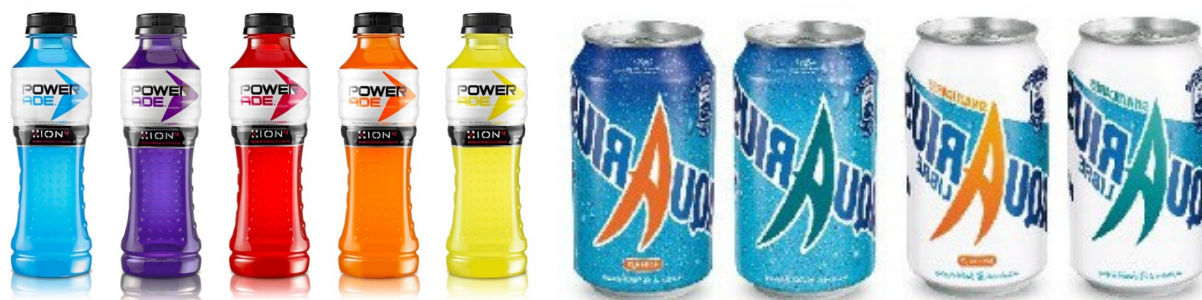
Figura 5. Imágenes de productos de Coca-Cola para promover la vida activa