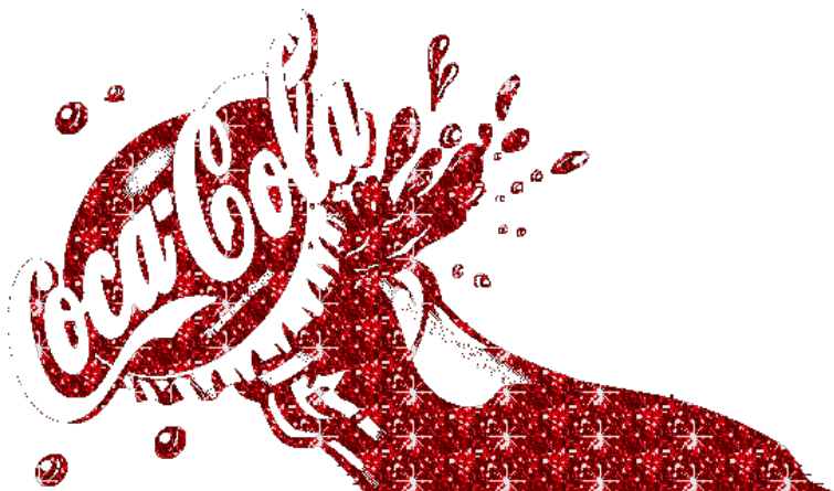
Figura 4. Cartel publicitario de la campaña “Razones para creer”

Fuente: [ http://www.cocacola.es ], accedida a 30/10/2015