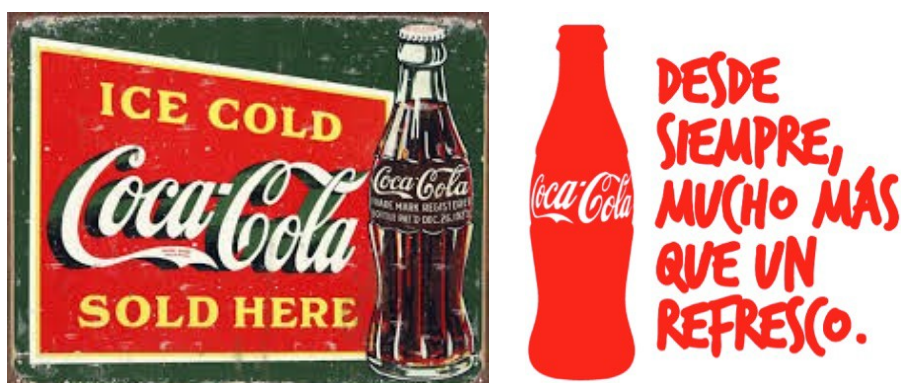
Figura 8. Ejemplos de imágenes publicitarias histórica y actual de Coca-Cola