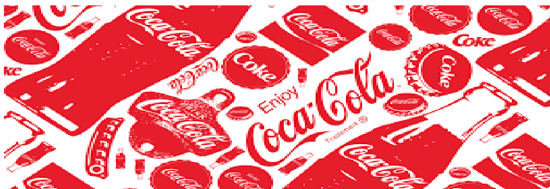
Figura 7. Cartel publicitario de la campaña “Enjoy Coca-Cola”