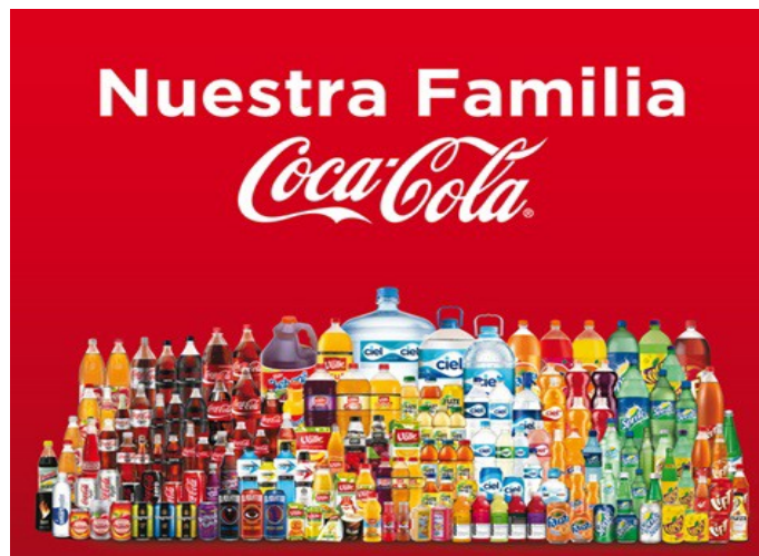
Figura 2. Las diferentes marcas y productos de Coca-Cola