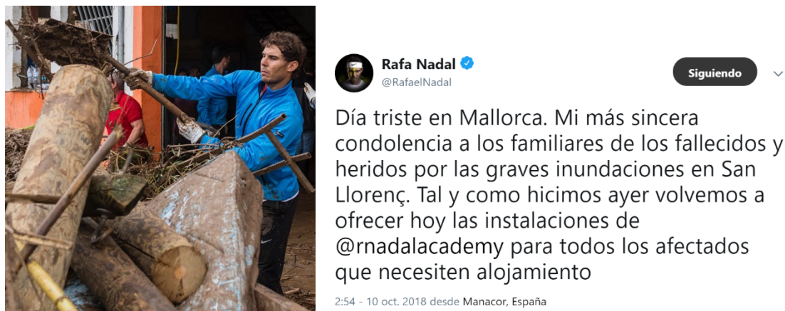
Figura 1. Imágenes de la página de Google y Twitter de la Rafael Nadal

A partir de aquí, realizaremos un análisis centrándonos en si fue realmente un acto altruista como él dice, y si tuvo una repercusión positiva para él y sus empresas. También analizaremos las opiniones al respecto de algunos de los afectados del municipio.