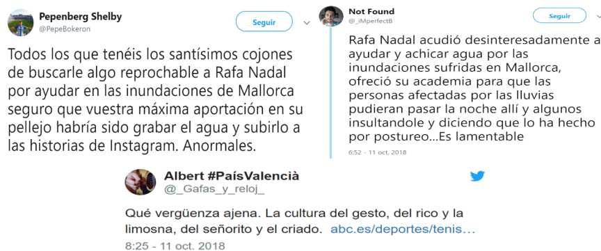
Figura 3. Ejemplos de comentarios positivos y negativos a la actuación de Rafa Nadal

Por otro lado, destacar que tanto el propio Rafa Nadal como sus empresas han hecho caso omiso a todo tipo de críticas y se han limitado a ofrecer únicamente su ayuda y sus instalaciones.