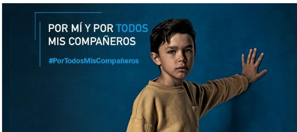
Figura 2. El protagonista del spot ganando el juego y salvando a sus compañeros.

Fuente: [ https://www.vigoalminuto.com/2019/05/13/portodosmiscompaneros-campana-de-ayuda-a-millones-de-ninos-impulsada-por-UNICEF_es/ ], a fecha 9/10/2020.