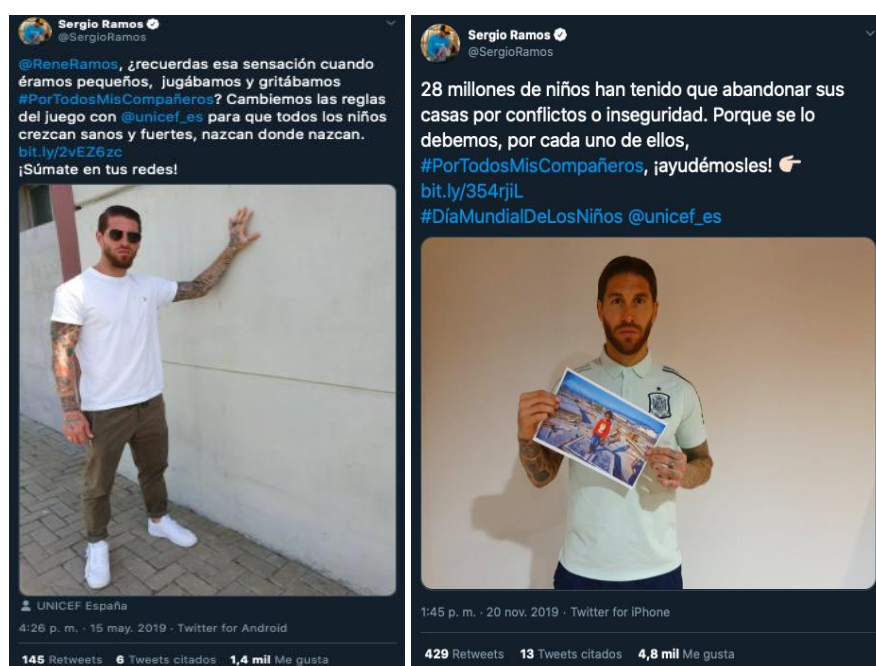
Figura 5. Tweets del famoso futbolista apoyando la campaña.