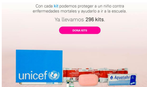
Figura 3. Sección de la página web donde se puede hacer la donación de kits.