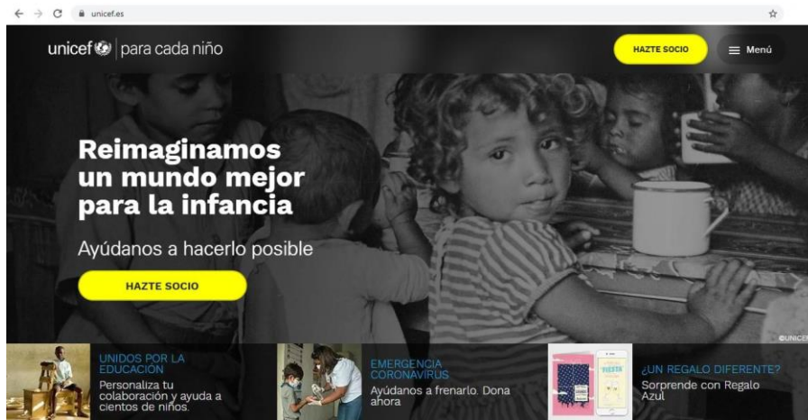
Figura 1. Pantalla de inicio de la página web oficial de UNICEF.