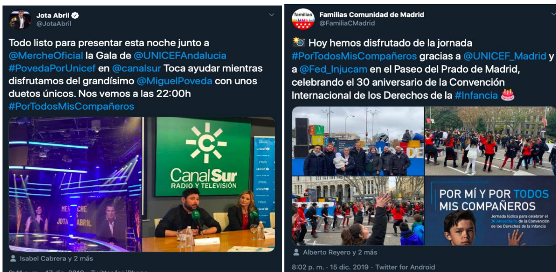
Figura 4. Tweets sobre los eventos organizados para promocionar la campaña.