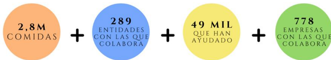
Figura 1. Datos de Educo desde 2013.