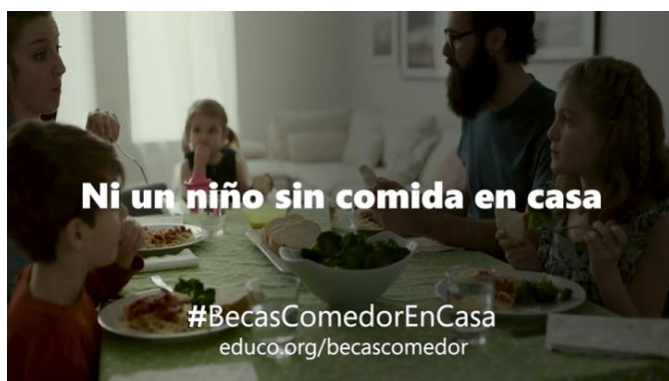
Figura 3. Campaña #BecasComedorEnCasa.