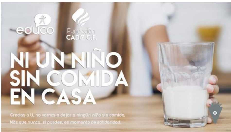
Figura 5. Post colaborativo del Cádiz C.F.