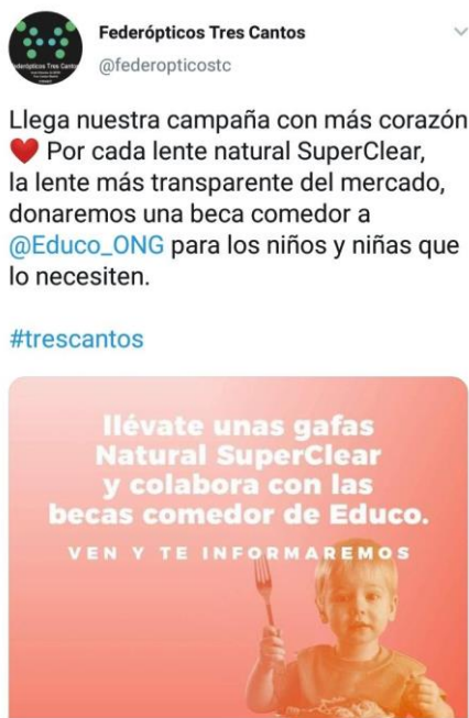
Figura 6. Post colaborativo de Federópticos.