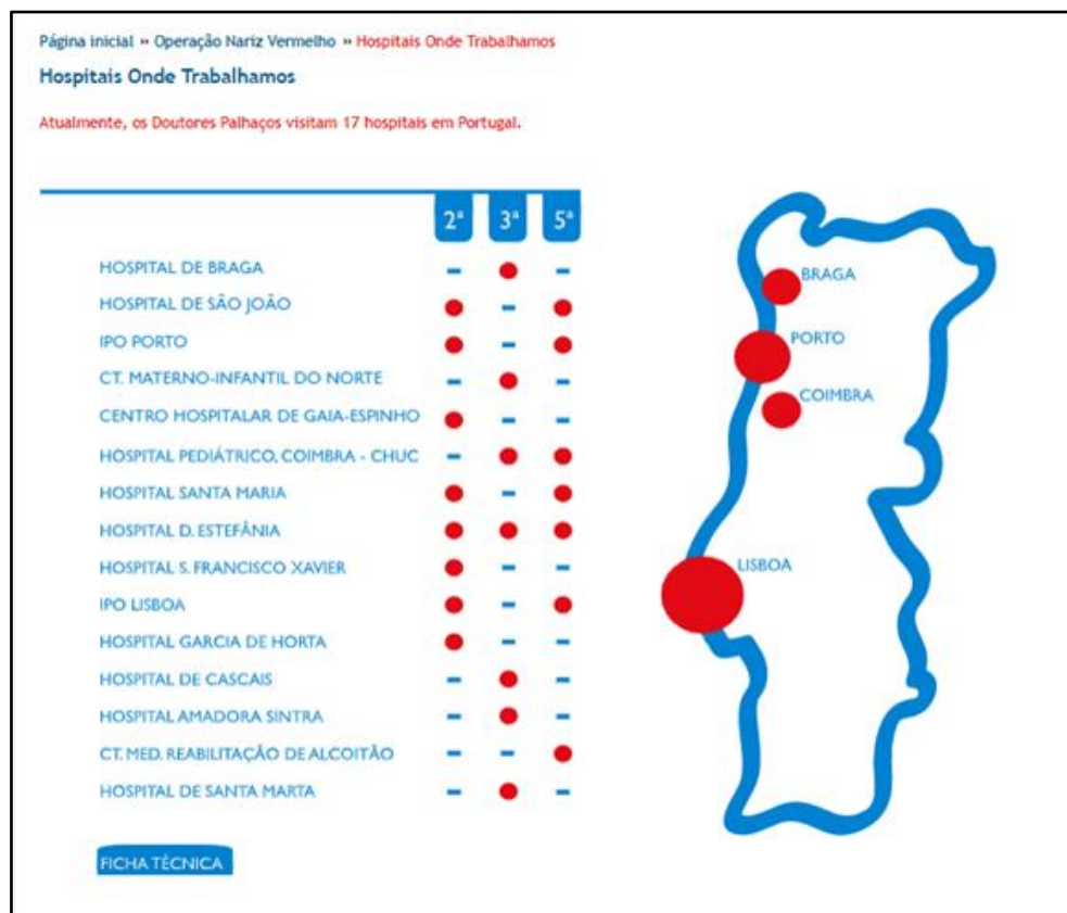
Figura 3. Implantação nacional da ONV

As organizações do sector social têm a particularidade de se suportar em grande parte por abnegado trabalho voluntário, além de que os resultados positivos (lucros) dos exercícios de gestão não podem ser distribuídos pelas pessoas que compõem a organização, tendo que ser reinvestidos na prossecução dos fins da organização.