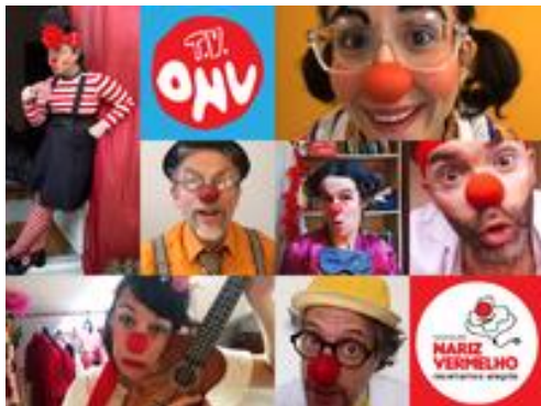
Figura 1. Genérico da TV-ONV ( YouTube ).

Confrontados com a pandemia Covid-19, reinventaram-se e inovaram criando a TV-ONV, canal no YouTube com o genérico que se mostra na Figura 1 e que permite que, de segunda a sexta-feira, às 11h00 e às 18h00, os Doutores Palhaços entrem nos serviços para a “consulta de alegria”.