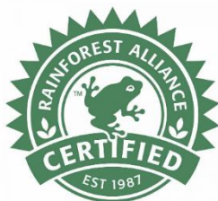
Figura 2. Selo oficial da Rainforest Alliance.