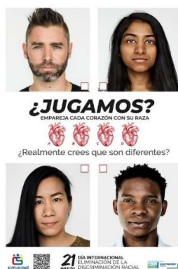
Figura 8. Cartel de la campaña ¿Jugamos?