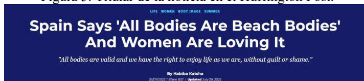
Figura 5. Titular de la noticia en el Huffington Post.