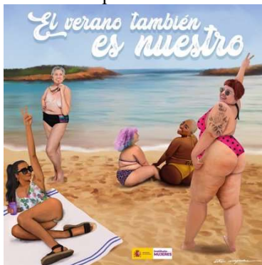
Figura 1. Cartel de la campaña El verano también es nuestro

Fuente: [ https://www.newtral.es/cartel-campana-ministerio-de-igualdad-el-verano-tambien-es-nuestro/20220802/ ], a fecha 03/10/2022.