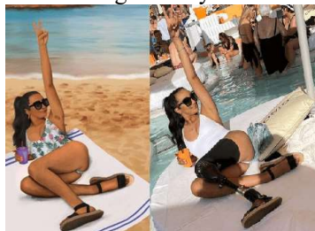
Figura 3. Comparativa de la imagen real y la ilustración del cartel.

Fuente:[ https://www.newtral.es/cartel-campana-ministerio-de-igualdad-el-verano-tambien-es-nuestro/20220802/ ], a fecha 03/10/2022