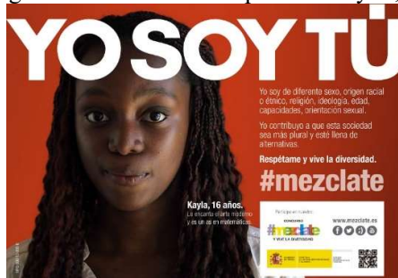
Figura 7. Cartel de la campaña Yo soy tú, mézclate.

Fuente: [ http://injuve.es/convivencia-y-salud/noticia/campana-yo-soy-tu-mezclate ], a fecha de 05/11/2022.