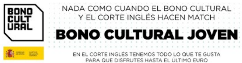
Figura 4. Campaña publicitaria de la asociación con El Corte Inglés