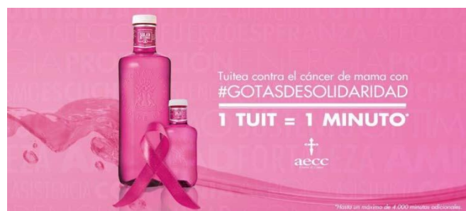
Figura 2. #GOTASDESOLIDARIDAD