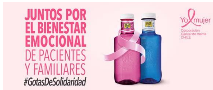
Figura 4. Solán X Yo Mujer.

Fuente: https://solandecabras.es/compromiso/sociedad/solan-por-yomujer/ Fecha de consulta: 24 de octubre de 2019