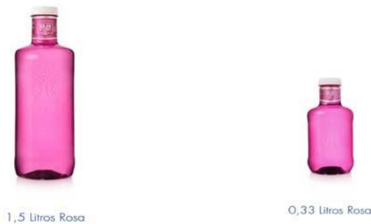
Figura 1. Modelos de las botellas de color rosa de la campaña “Gotas de Solidaridad”.

Fuente: https://solandecabras.es/productos/agua/ Fecha de consulta: 20 de octubre de 2019