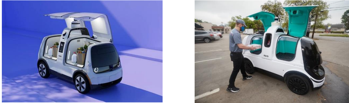
Figura 2. R2 de Nuro

mantener la comida a la temperatura ideal. Nuro ha implementado módulos de calor y frío para que los alimentos se puedan conservar entre los -5^{\circ}\text{C} y 46^{\circ}\text{C} (elespañol.com, 2022).