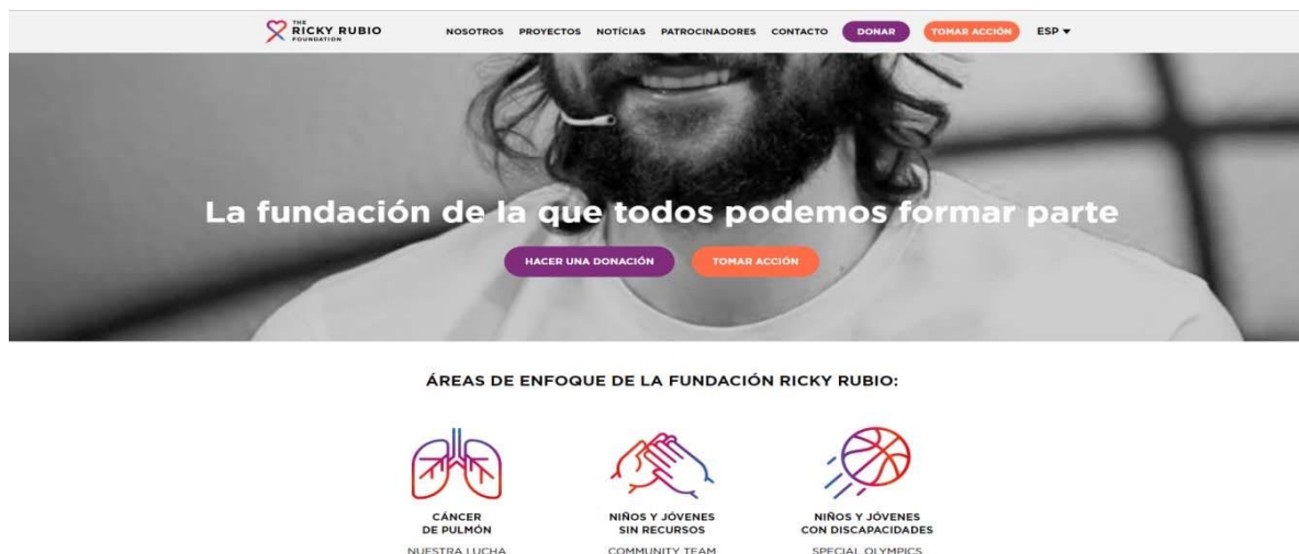
Figura 1: Página web de la fundación.