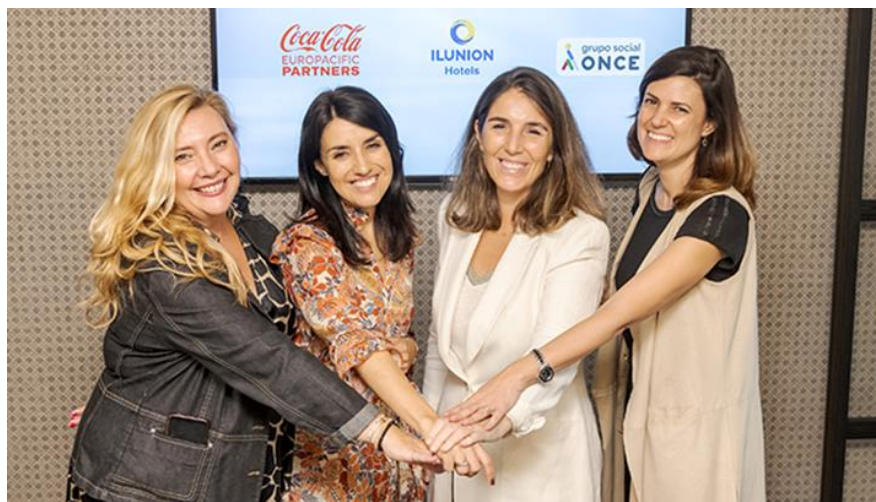
Figura 5. Imagen de la alianza entre ILUNION y Coca-Cola.

Desde ILUNION Economía Circular se desarrollan y fomentan actividades innovadoras creando un triple impacto económico, social y medioambiental. ILUNION ha establecido una alianza con Coca-Cola, que tiene también una clara apuesta por la economía circular como modelo de crecimiento sostenible.