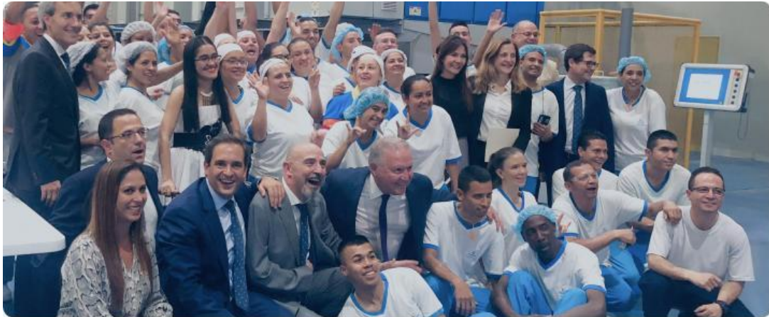
Figura 2. Imagen de los trabajadores de la primera lavandería industrial de ILUNION en Colombia.