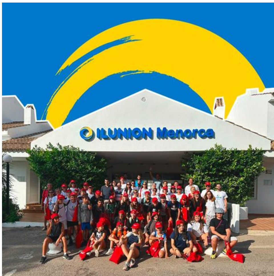
Figura 6. Imagen de la VI Edición de Mares Circulares en Menorca, en octubre 2023.

El pasado mes de octubre de 2023, ILUNION Hotels participó en una jornada de recogida de residuos que se organizó en Cala Galdana. Esta acción pertenecía a la sexta edición del programa Mares Circulares.