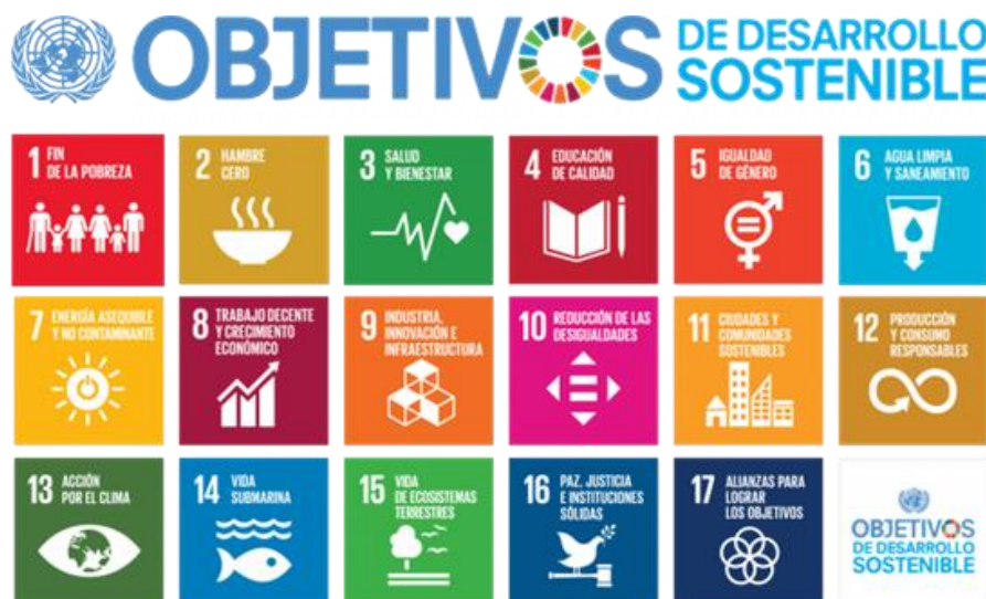
Figura 4. Imagen de los objetivos de desarrollo sostenible.

Los Objetivos de Desarrollo Sostenible u Objetivos Globales son unos objetivos que están interconectados y han sido diseñados para ser un “plan para lograr un futuro mejor y más sostenible para todos”. Los ODS fueron establecidos en 2015 por la Asamblea General de las Naciones Unidas y se pretende alcanzarlos en 2030.