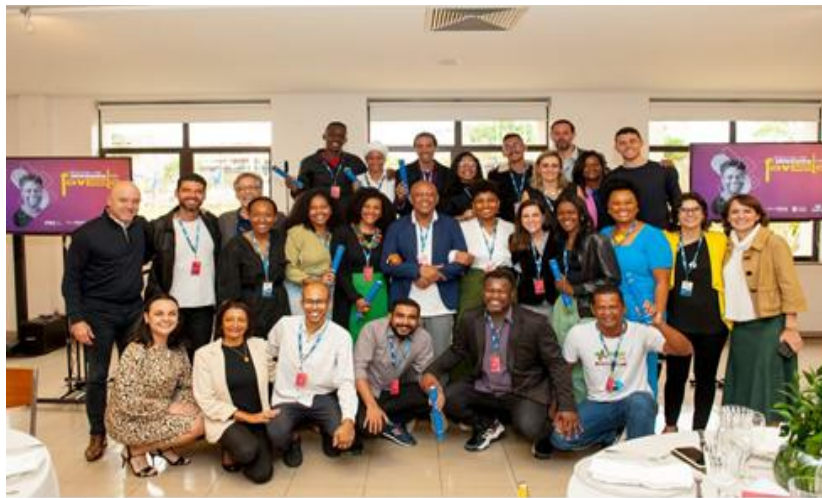
Figura 1. Primeira turma de empreendedores da Escola de Negócios da Favela