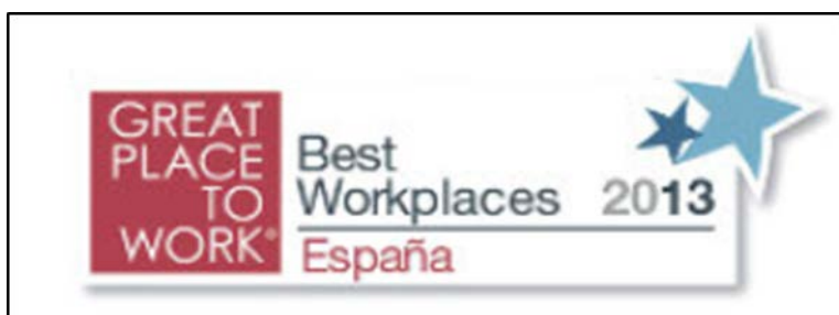
Figura 4. Logo Best Workplaces 2013 – España.