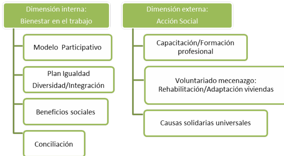
Figura 1. Marco de RS: Personas.