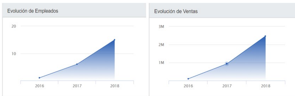
Figura 8. Gráfico sobre la evolución de la empresa