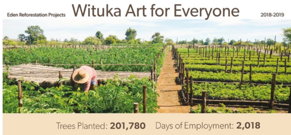
Figura 4. Organización Eden Reforestation Projects