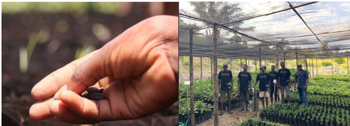
Figura 5 - 6. Organización Eden Reforestation Projects